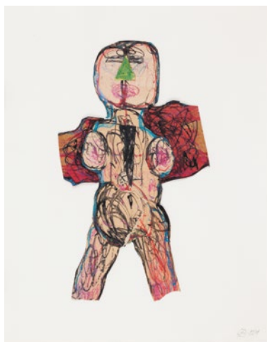
Daimoneasa , 1981

Colajul Daimoneasa (1981), o reprezentare expresionist-hieratică a unei figuri feminine, ce se înfățișează privirii încă din exteriorul