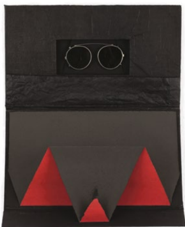
Ochelarii tatălui meu, 2005 Asamblaj, ochelari, hârtie, 42 x 32.5 cm

Prima direcție se concentrează în jurul a două lucrări în care se poate vizualiza atelierul: Nu violenței! și Atelierul . Seria de fotografii cuplate cu instalația Nu violenței! , concepută pentru prima dată în 1974, prezintă un happening în atelier, în timpul căruia artista se auto-reprezintă cu corpul ghemuit, într-o ipostază a fragilității, în proximitatea