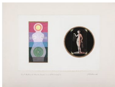
Faust , 1981–82

Serie de 31 desene, tempera și colaj pe hârtie, 51 × 67,6 cm fiecare