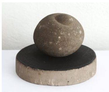
Piatra care naște , anii '60

Serie de nouă fotografii a/n, 50 × 50 cm fiecare