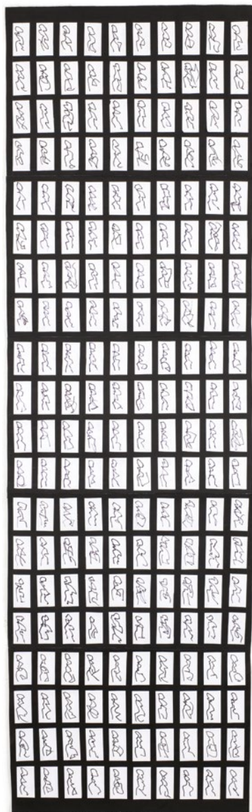
Femei, 2007 Colaj de 200 de desene cu ochii închiși pe hârtie, 172 × 51 cm

Tema memoriei este explicit abordată în ultima secțiune a expoziției, care prezintă seriile Amintiri din copilărie (1975–78) și Memorie (1990). Deși Geta Brătescu nu insistă în textele ei asupra unor confesiuni auto-biografice, crâmpoie de autobiografie apar inevitabil, tocmai pentru că travaliul memoriei și cel al imaginației funcționează într-o comunicare permanentă. Amintiri din copilărie captează tocmai această ambiguitate a procesului rememorării. Efortul de a extrage reprezentări