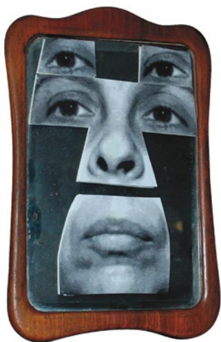
Autoportret în oglindă, 2001 Obiect, oglindă, lemn, colaj fotografic, 21 × 15 cm