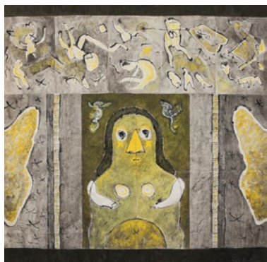
Mume , 1997

Colaj, tempera și tuș pe hârtie, triptic, 104.5 × 104.3 cm, 103.8 × 76.3 cm și 103.8 × 76.3 cm