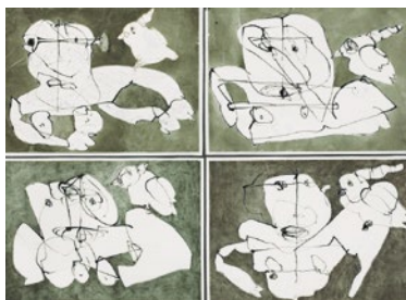
Eu și pasărea Bird , 1993

Colaj, tempera și tuș pe hârtie, triptic, 104.5 × 104.3 cm, 103.8 × 76.3 cm și 103.8 × 76.3 cm