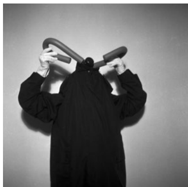
Alteritate , 2002–2011

Consistența, integritatea, calitatea estetică și intelectuală a demersului Getei Brătescu, incredibila prezență a artistei – care se dezvăluie prin lucrările în care ea se auto-reprezintă, dar și în personajele feminine pe care le invocă – transformă Pavilionul României și Noua Galerie într-un „atelier continuu” pentru fiecare vizitator în parte.