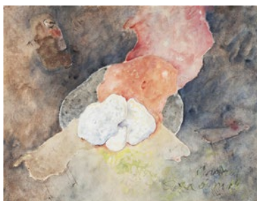
Amintiri din copilărie , 1975–78

Serie de șapte desene, acuarelă pe hârtie, 44 × 56 cm fiecare