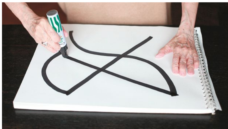
Linia , 2014, video HD, 14:50 min Imagine, sunet, editare: Ștefan Sava