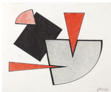
Jocul formelor , 2013

Desen și colaj pe hârtie, 52.5 × 42.5 cm