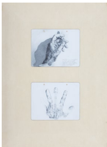
Mâini, 1974–76 Serie de 20 desene pe hârtie, montate pe 10 coli de carton, 67.3 x 49.3 cm fiecare coală