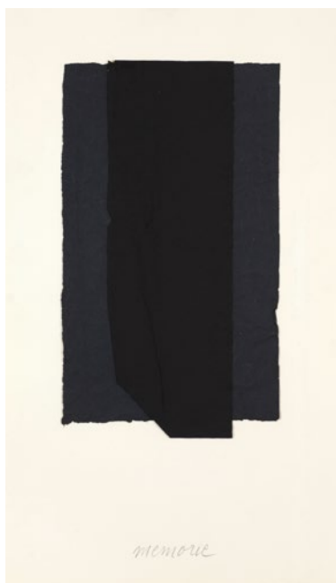
Memorie, 1990 Serie de 40 colaje pe hârtie, 62 × 36.5 cm fiecare

din aceste alcătuirii nebuloase conduce la rezultate care se situează la limita vizibilului. Ciclul Memorie produce una din concluziile acestui periplu complex. Aici, memoria e obliterare și repetiție; ea poate fi înțeleasă ca automatism și proces lipsit de finalitate, care, la fel ca arta, pulsează prin mișcarea pură a spiritului.